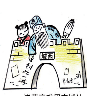
诸葛亮难用空城计