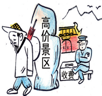
徐霞客没钱买门票