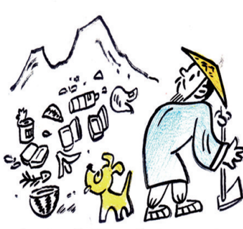
陶渊明气愤见南山