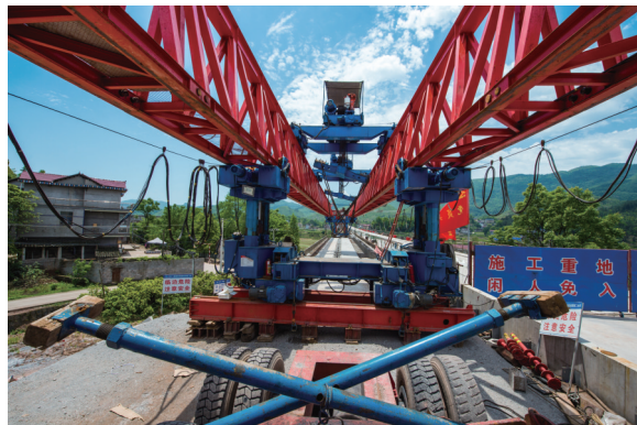
建设中的利福塔火车站连通桑植隧道桥梁工地