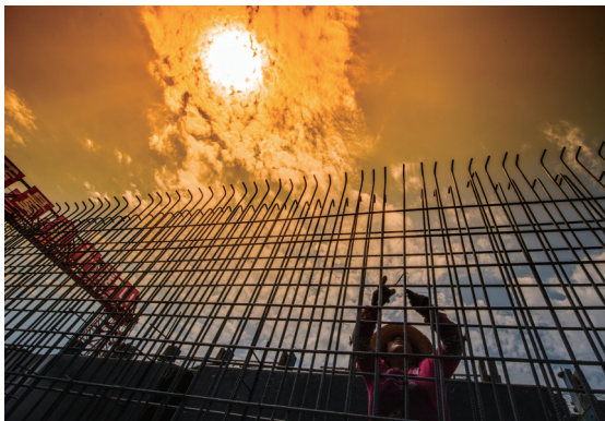
高铁桥梁扎丝工