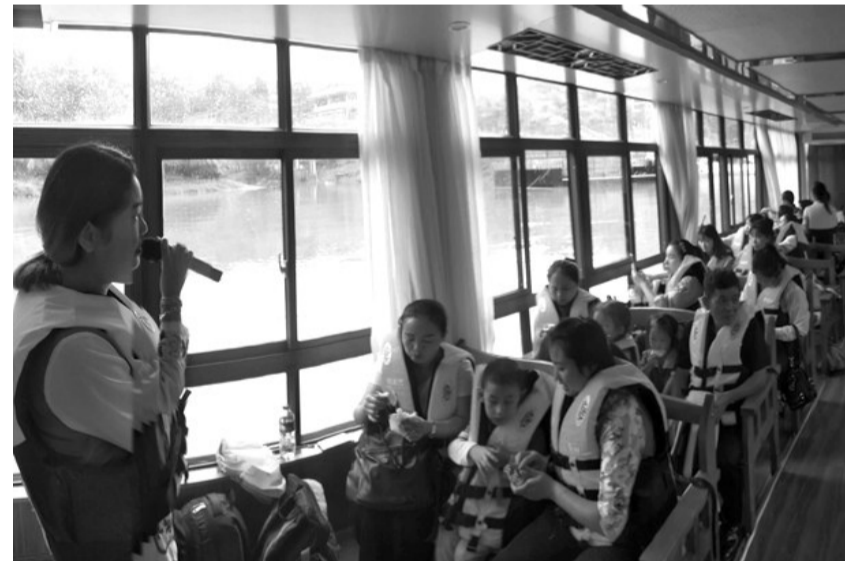
9月21日，张家界爱心林启智教育学校举办“西线邀我来旅游，我到西线乐悠悠”残健融合亲子活动，50多名自闭症、智障孩子与家长、老师、中国人寿财产保险张家界分公司爱心志愿者一起共同体验了茅岩河平湖游。

容包括大队消防宣传员现场指导师生进行疏散逃生演练；就乡镇经典案例进行分析讲解、教授常见消防器材和设施的使用、如何报警、火灾疏散逃生等消防知识；发放300余份消防安全宣传资料。 消防知识培训下乡活动深受乡镇群众欢迎，桥头乡参训领导干部、中心小学师生对平安消防中秋大礼包尤为喜爱，纷纷表示，通过大队消防安全知识的普及、培训和实地操练，不仅提升了乡镇消防安全责任意识，还加强了乡镇群众疏散逃生的能力，筑牢了乡镇的防火墙。 (郭鸿儒)