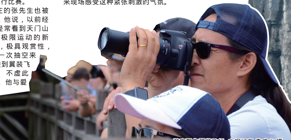
游客围观翼装飞行