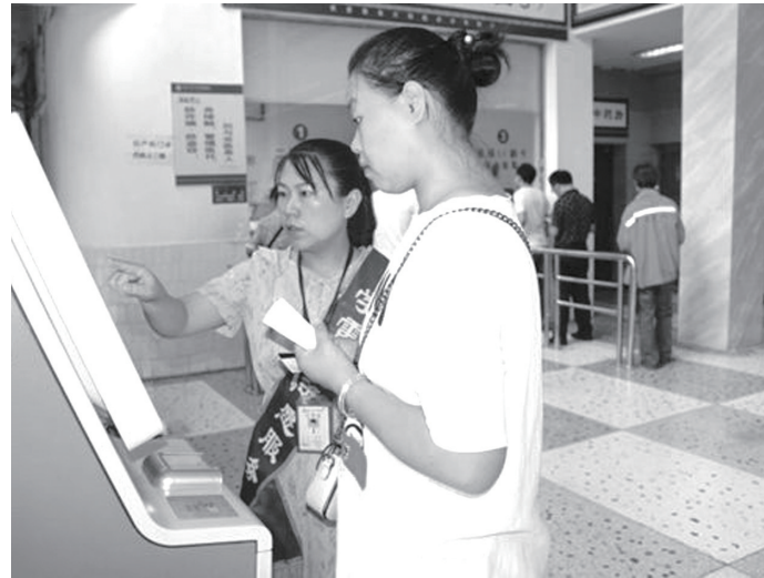
近日，市中医医院 雷锋志愿者站点 在门诊一楼大厅建立 志愿者队伍 每天分组轮流上岗，为患者提供志愿服务。

两位技术骨干分别在人潮溪镇派出所和原白石乡政府所在地为双目失明的老人、晕车的老人 and 五保老人等40多名困难群众办理身份证。当天，便民小分队行程200多公里，为边远山区45名老弱病残群众解决了急需解决的问题，直到晚上11点才返回。（钟懿 谷将伟）