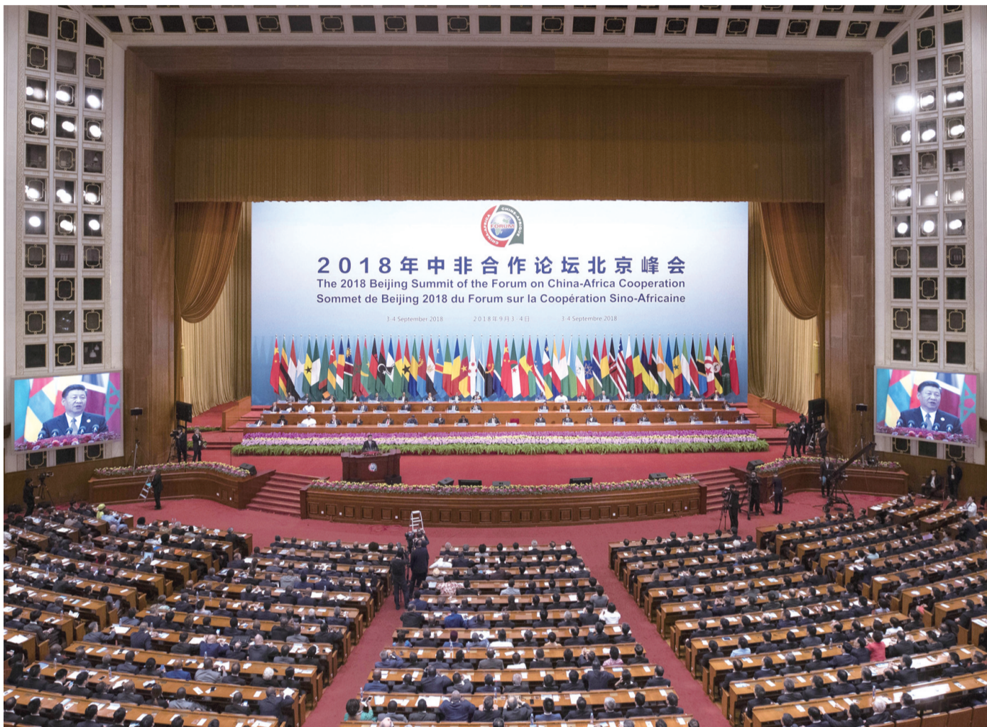
右图：中非合作论坛北京峰会会场。

新华社北京9月3日电(记者白洁 朱超 丁小溪)3日,中非合作论坛北京峰会在人民大会堂隆重开幕。中国国家主席习近平出席开幕式并发表主旨讲话,强调中非要携起手来,共同打造责任共担、合作共赢、幸福共享、文化共兴、安全共筑、和谐共生的中非命运共同体,重点实施好产业促进、设施联通、贸易便利、绿色发展、能力建设、健康卫生、人文交流、和平安全 八大行动。