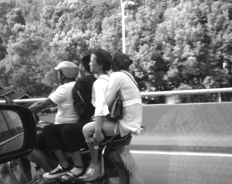
摩托车超载，危险！8月16日8:28摄于市城区南庄坪高架桥上。