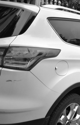
市城区南庄坪双拥路人行道上，车辆乱停乱放现象严重。