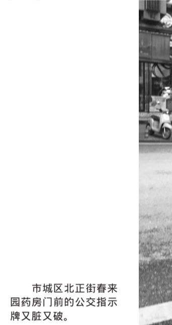
市城区北正街春来园药房门前的公交指示牌又脏又破。